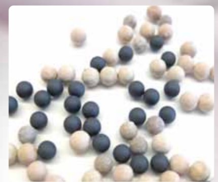
独自開発の抗菌ゼオライト

カドー加湿器は、ゼオクレア・テクノロジーで、タンク内の水と空気中の細菌を一度に除去。ゼオクレア・テクノロジーは、独自開発の抗菌ゼオライト(沸石)を用いたものです。このゼオライトは、タンク内の水を抗菌し、更に空気中にミストとして放出され、ウイルスや浮遊菌を抑制します。カドー加湿器は、安心して快適な住空間をつくれます。